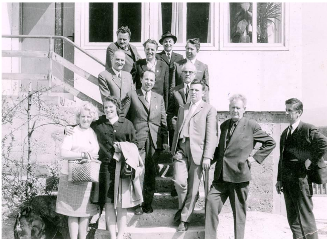
Del ustanovnih članov in gostje

Še isti dan so se konstituirali upravni organi društva.