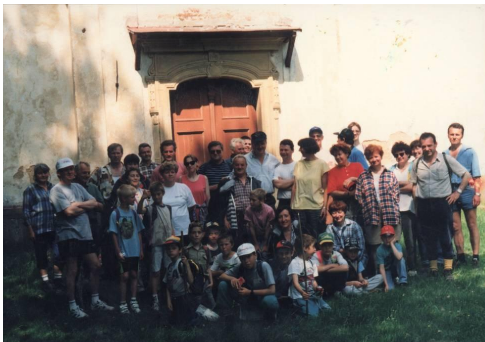
Udeleženci srečanja pri Sv. Ignaciju (in nato pri Glančniku)

Na Lovrenška jezera je pohod v mesecu avgustu, ko praznujemo lovrenško nedeljo in imamo občinske prireditve Jezernikovi dnevi. Pohoda se ob lepem vremenu udeleži okoli 200 pohodnikov. Pot vodi od Kulturnega doma preko Recenjaka in Vrelenka po standardni markirani poti do jezer, nato pa po posebej označeni poti v gozdu pod jezerjem do Jezerca. Tiste člane, ki niso sposobni triurne hoje po običajni poti, pripelje avtobus do Mašin žage, od koder se podajo na Lovrenška jezera in do Jezerca. Na Jezercu imamo kulturni program in malico. Vračamo se po levem bregu Radoljne skozi bivši kamnolom, nato pa po markirani poti ob Radoljni (bivša pruharska cesta) do gostišča Sgerm, kjer si zadnjič privežemo dušo in se poslovimo.