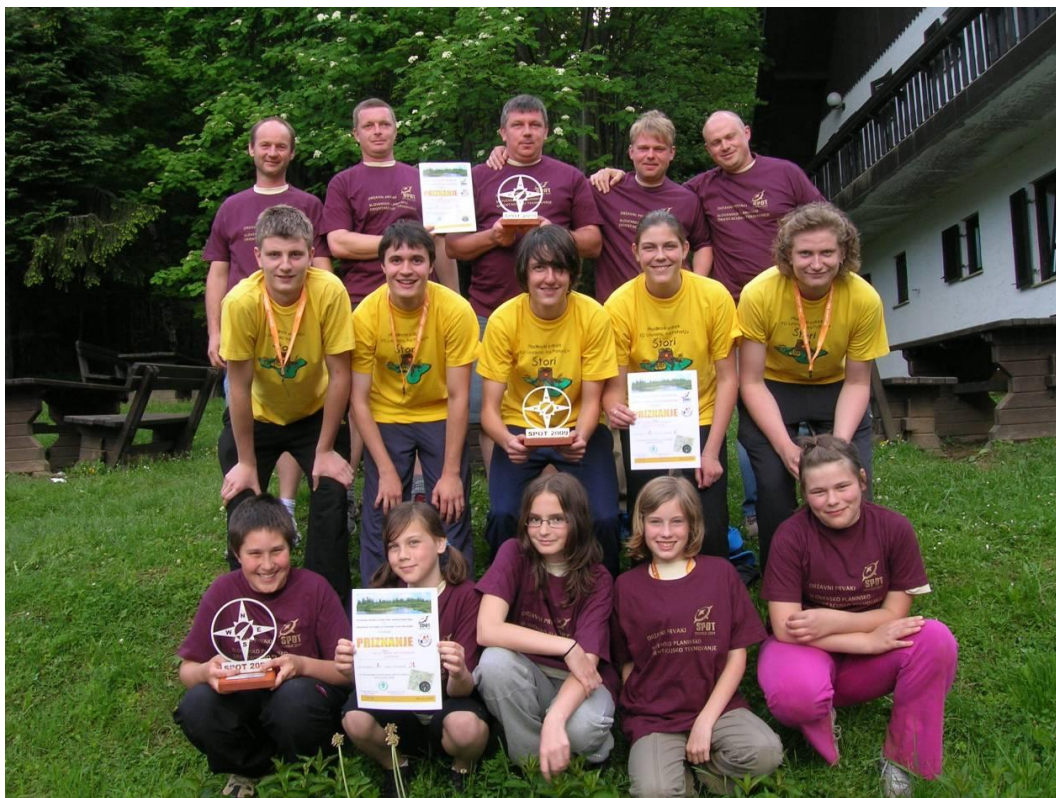
2009 – SPOT Areh: Lauženki (prvi), Jodlove pakleše (drugi), Vunatni žoki (prvi)