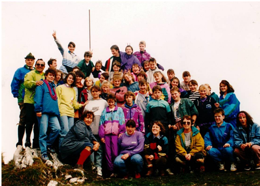
Učenci osmega razreda na Uršlji gori (planinski športni dan)