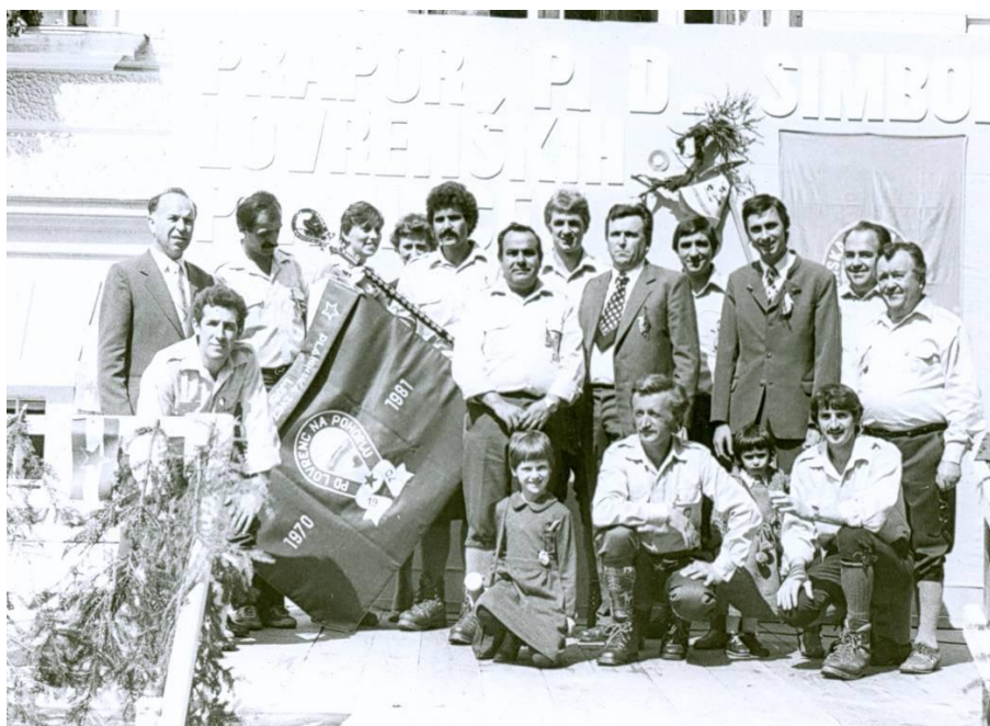
Ob razvitju prapora