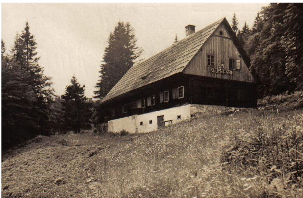
Stara kočja na Klopnem vrhu

V času denacionalizacije je predsednik Pačnik dal 3. decembra 1993 na Upravno enoto Ruše zahtevek za vračilo zemljišča, na katerem je stala požgana planinska kočja na Klopnem vrhu. UE Ruše je 8. junija 2001 zavrnila ta zahtevek.