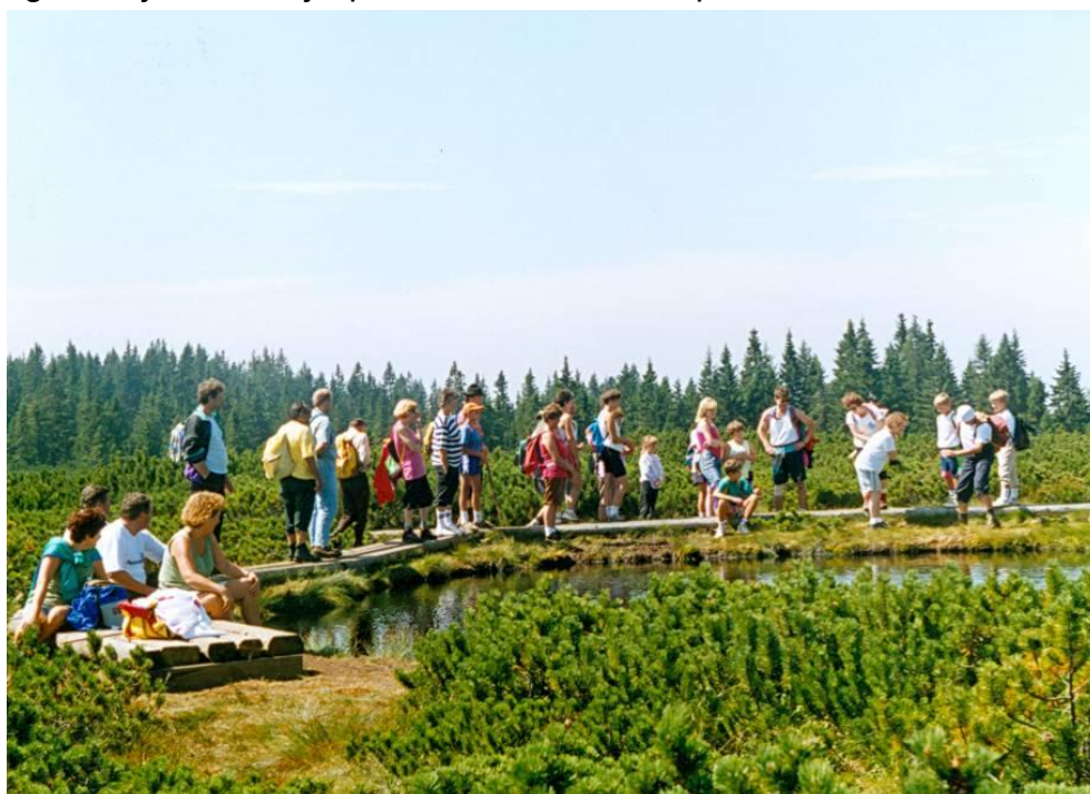
Pohodniki na Lovrenških jezerih

Na Lovrenška jezera je pohod v mesecu avgustu, ko praznujemo lovrenško nedeljo in imamo občinske prireditve Jezernikovi dnevi. Pohoda se ob lepem vremenu udeleži okoli 200 pohodnikov. Pot vodi od Kulturnega doma preko Recenjaka in Vrelenka po standardni markirani poti do jezer, nato pa po posebej označeni poti v gozdu pod jezerjem do Jezerca. Tiste člane, ki niso sposobni triurne hoje po običajni poti, pripelje avtobus do Mašin žage, od koder se podajo na Lovrenška jezera in do Jezerca. Na Jezercu imamo kulturni program in malico. Vračamo se po levem bregu Radoljne skozi bivši kamnolom, nato pa po markirani poti ob Radoljni (bivša pruharska cesta) do gostišča Sgerm, kjer si zadnjič privežemo dušo in se poslovimo.