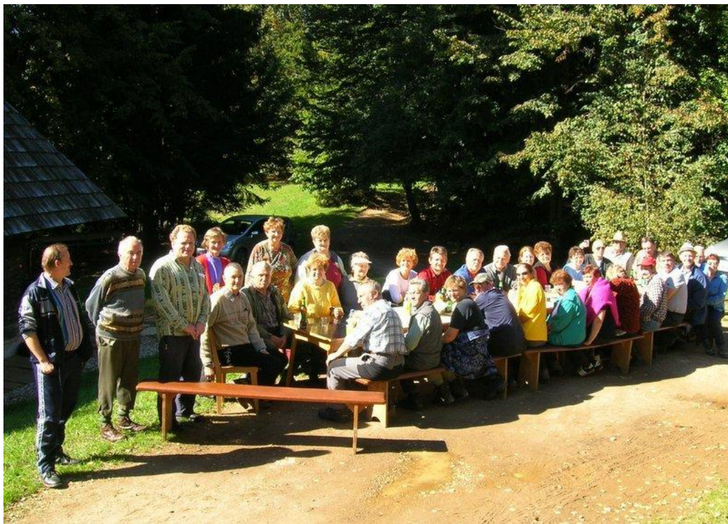
S pohoda Francov k Sv. Ignaciju

V tem letu smo prvič organizirali Pohod Francov . Nastal je zaradi ugotovitve, da ima največ članov društva ime Franc, saj so se na vsakem izletu znašli vsaj trije. Pohod je družabno srečanje Francov, Frančk, njihovih partnerjev in simpatizerjev. Cilji dosedanjih pohodov so bili: Štiblerjev vrh na Ruti, Meranovo, čez Rothuobo na Kumen, po večni poti k Sv. Ignaciju na Rdečem bregu, čez Kumen na Loge, prečenje Rdečega brega, po Recenjaku itd.