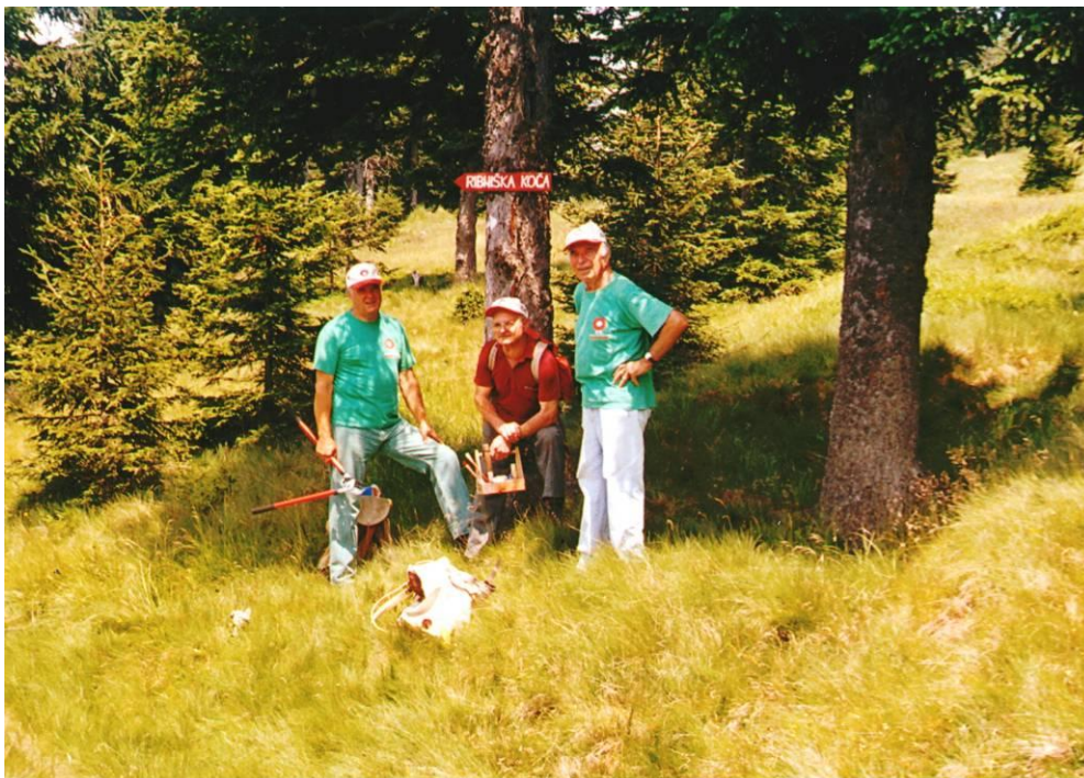
Markacisti na akciji

Vodniki so izvedli 18 izletov, ki se jih je udeležilo 766 planincev.