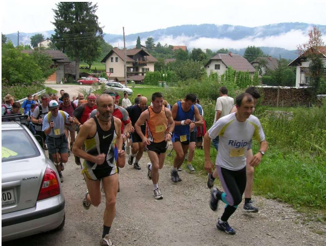
2005 - Horuk na Klopni vrh

Prvič smo izvedli Horuk na Klopni vrh , ki obsega poleg normalnega planinskega pohoda še športno različico – tek od Jakopičevega mosta na Klopni vrh.