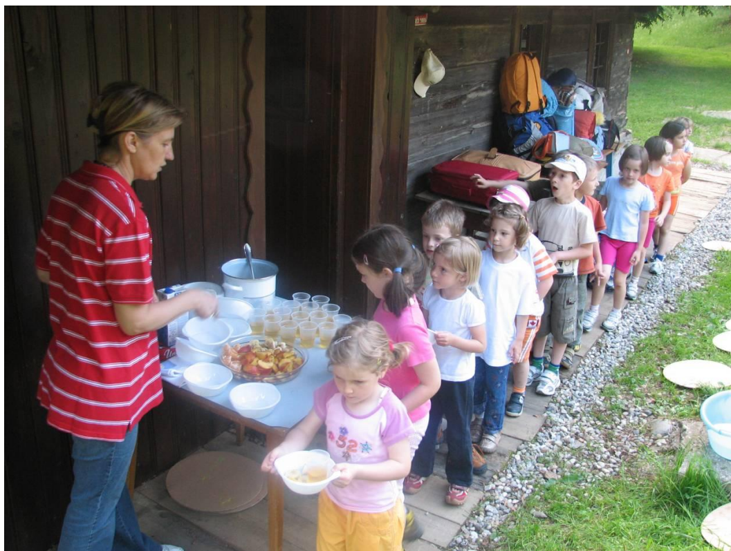
Najmlajši planinci na taboru pri Sv. Ignaciju

Markacisti so znova opravili geokontiranje vseh planinskih poti na našem področju za računalniško evidenco na planinski zvezi, saj lansko ni uspelo. Na vzdrževanju poti so opravili 430 delovnih ur. Ob vstopu v področje Lovrenških jezer so podaljšali brunaste mostnice preko močvirja, ki je kazilo vstop.